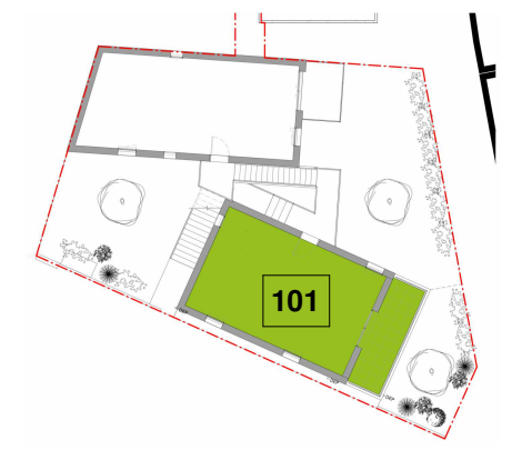
Plan de localisation