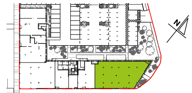
Plan de localisation