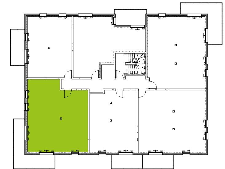
Plan de localisation