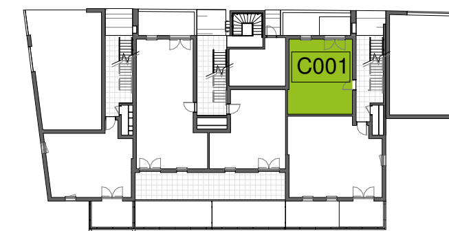
Plan de localisation