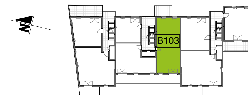
Plan de localisation