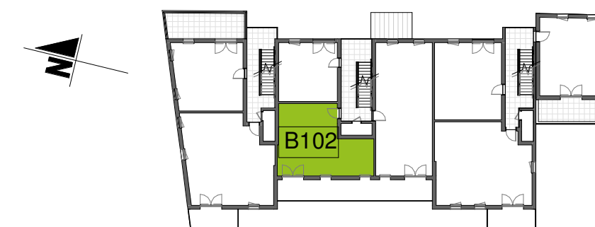
Plan de localisation