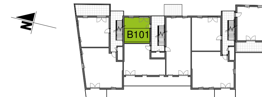
Plan de localisation